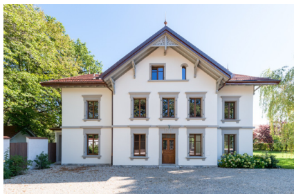
Façade nord assainie