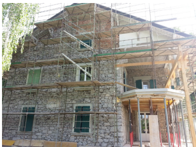
Phase de décrépiage des façades