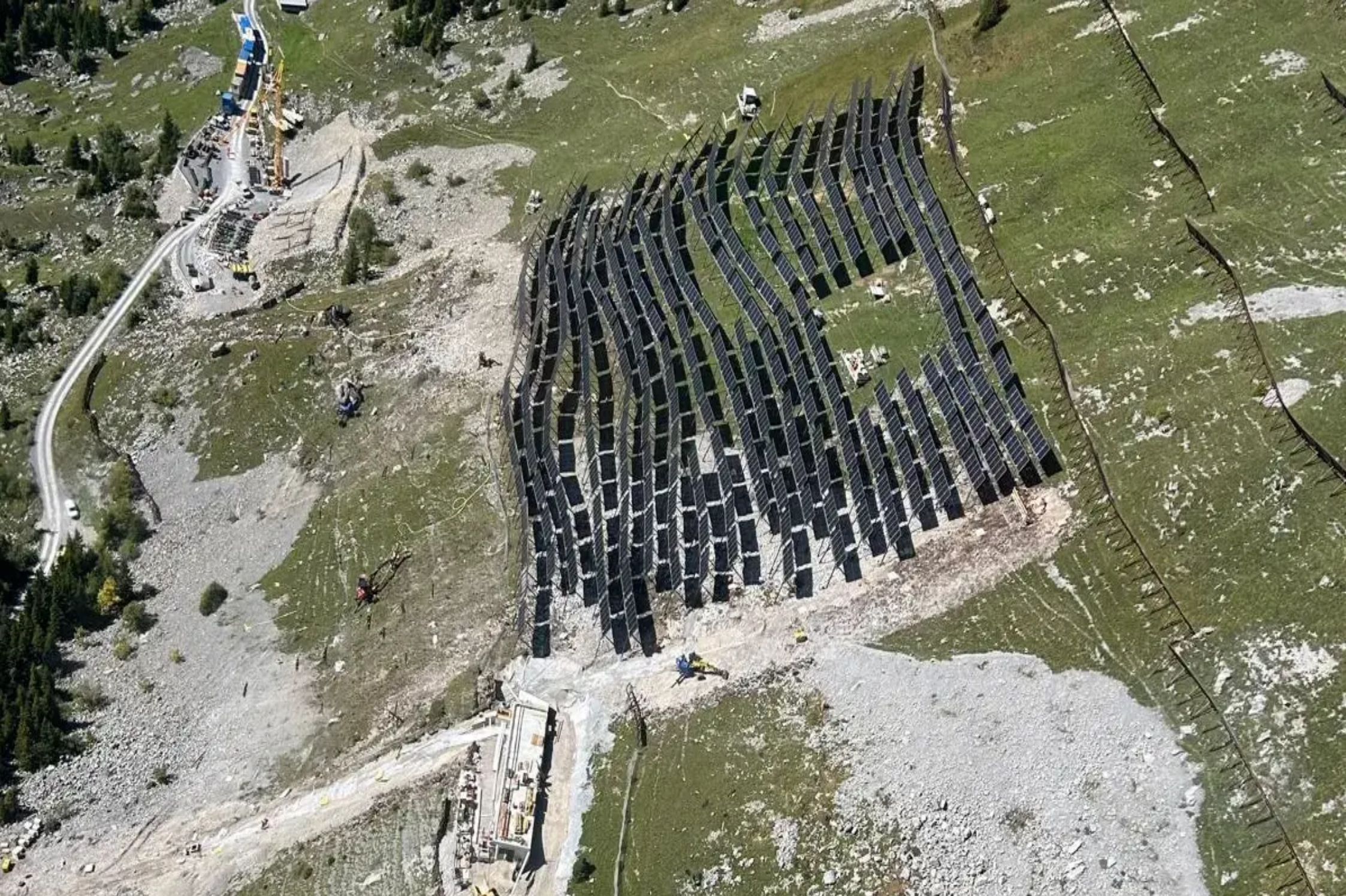
Alpine Photovoltaikanlage APV Sidenplangg Spiringen