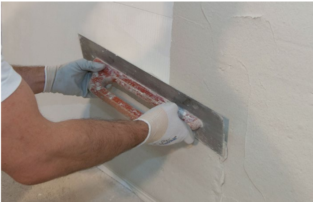
1) Aufbringen des weißen RÖFIX Renoplus®