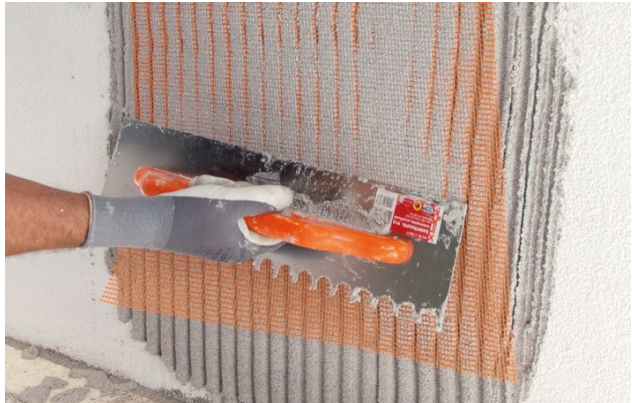
2) Einbetten des RÖFIX P100 Armierungsgewebe grob