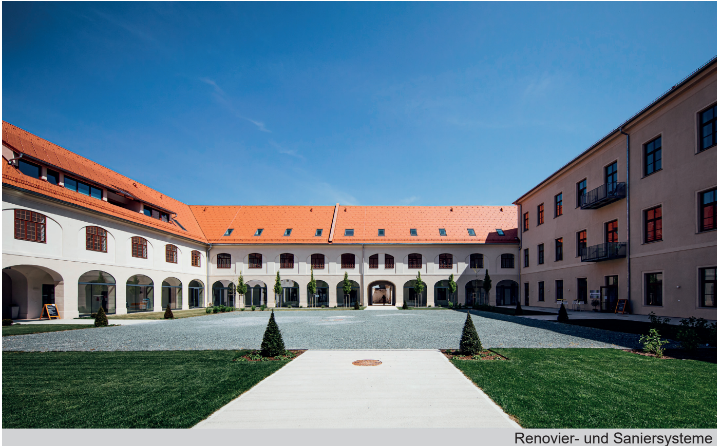
Renovier- und Saniersysteme