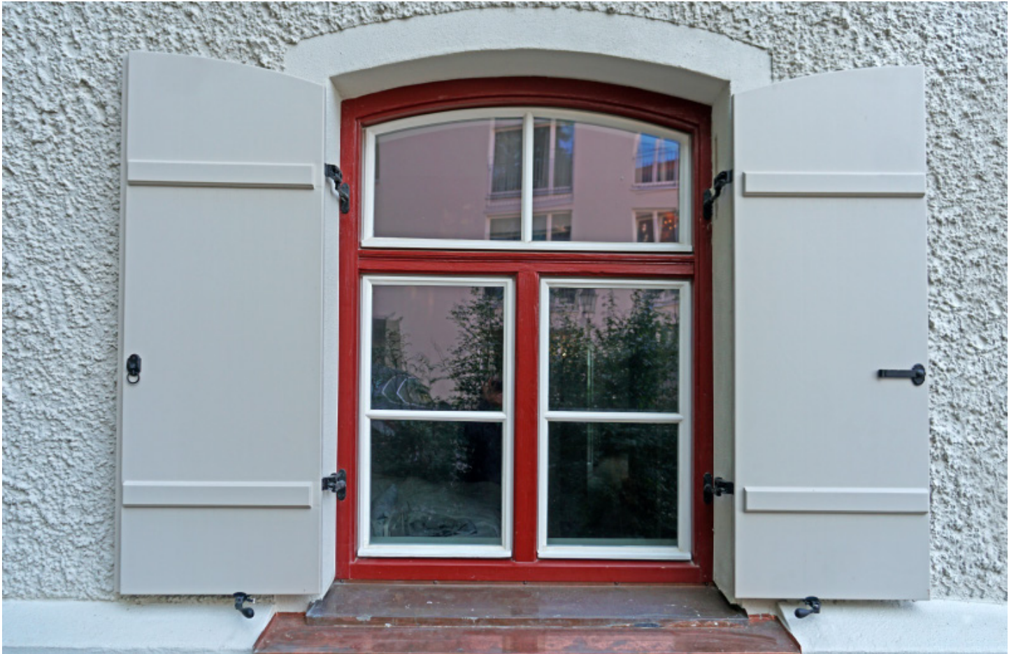
Außenfassade mit Fensterumrahmungen