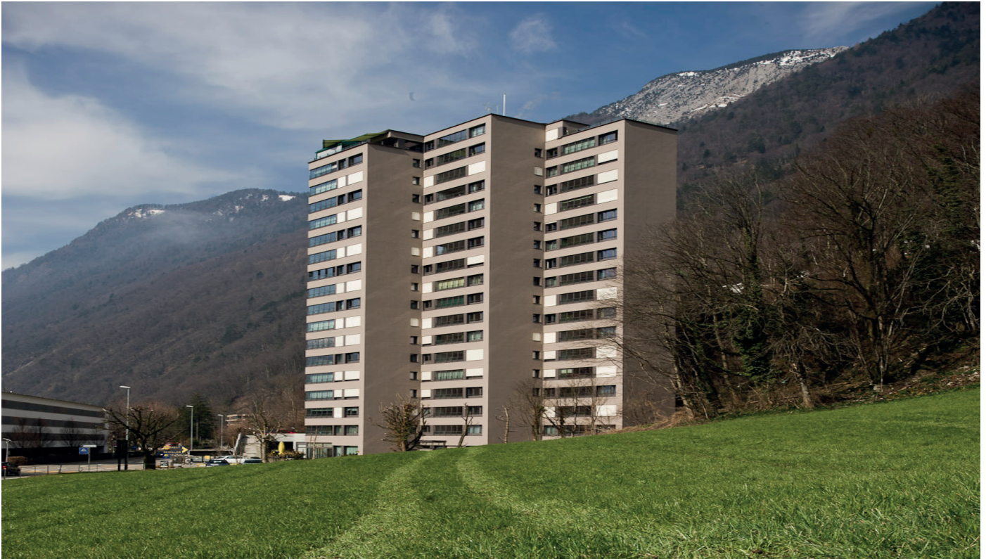
GreoTherm® Système M