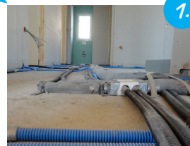
Podklad připravit a instalace zafixovat