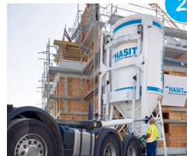
Po přistavení sila se nastaví konzistence