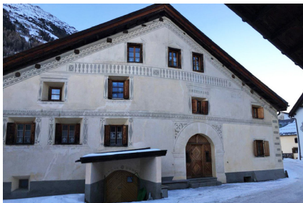
Südfassade vor energetischer Sanierung