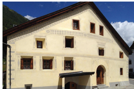
Südfassade nach energetischer Sanierung