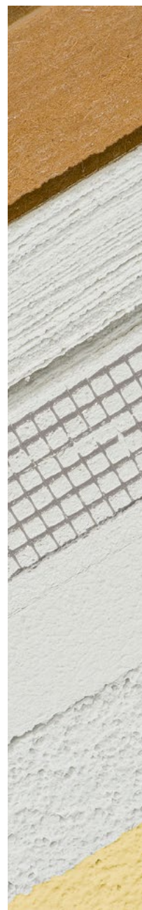
GreoTherm System HF

Bei dunkler Endbeschichtung ist zwin-gend ein zweifacher Farbanstrich mit der filmkonservierten Fassadenfarbe GreoColor OptiTop IR erforderlich.