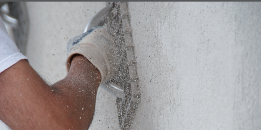
Rabotați suprafața cu un produs de șlefuire RÖFIX

După uscarea suficientă (12-24 h, în funcție de temperatură și de condițiile de vreme), suprafața este, de preferință, rabotată cu un produs de șlefuire RÖFIX „Tip: Mediu”. Timpul de rabotare este selectat corect atunci când tencuiala nu se mai lipește de raclă de metal.