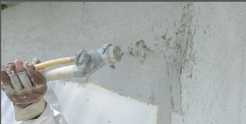
A doua aplicare se realizează după ce primul strat de tencuială s-a uscat

A doua aplicare se realizează după ce primul strat de tencuială s-a uscat – în mod ideal în ziua următoare.