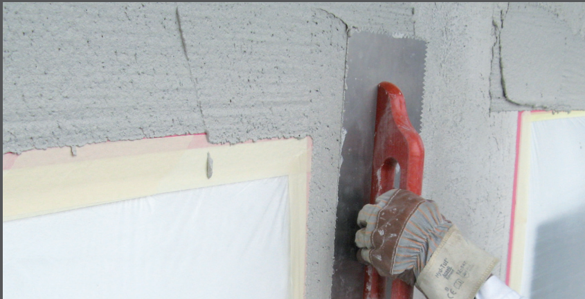
Aplicarea primului strat la dimensiunea granulației

Tencuiala cu efect de piatră pentru straturi în pat mediu RÖFIX 773 este aplicată în două straturi: primul strat la dimensiunea granulației, al doilea strat în 6-8 mm (în funcție de granulație). După întărire suprafața este ușor drisăcuiță.