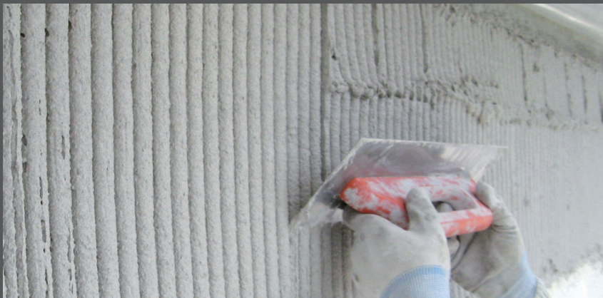
Pieptănați cu mistria dințată RÖFIX R16 într-o direcție

Cu mistria dințată RÖFIX R16, tencuiala cu efect de piatră este pieptănată într-o singură direcție pentru a obține grosimea uniformă corespunzătoare a stratului (în funcție de granulație).