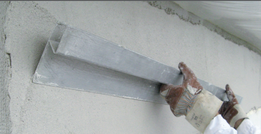
Nivelați suprafața cu o placă de nivelare

Suprafața este nivelată în plan cu ajutorul unei plăci de nivelare pentru a asigura o suprafață plană.