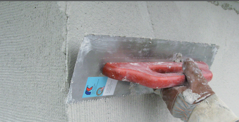
Aerisiți suprafața cu mistria dințată ascuțită RÖFIX S6

Pentru a evita golurile de aer, aerisiți suprafața cu mistria dințată ascuțită RÖFIX S6. Structura suprafeței striate fin se poate întări în acest mod.