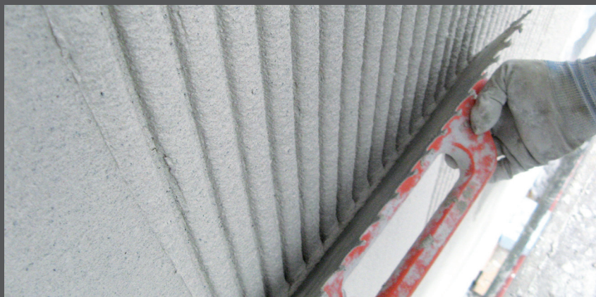
Cu partea netedă a mistriei neteziți în stare proaspătă

Cu partea netedă a mistriei, tijele dințate sunt netezite în aceeași direcție imediat în stare proaspătă, fără îndepărtarea materialului, iar dinții trebuie presați pe suprafață.