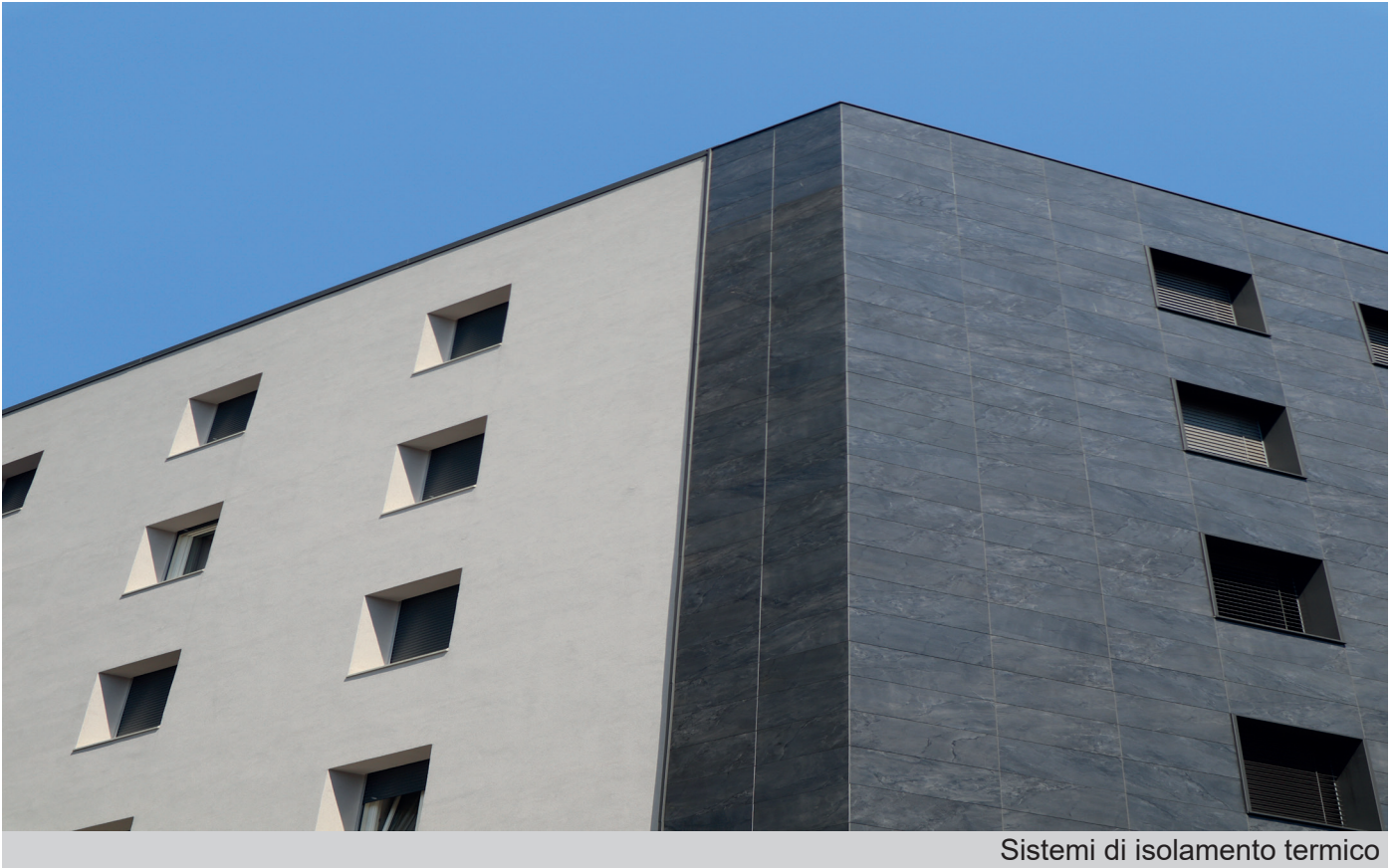
Sistemi di isolamento termico