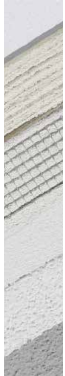
Système PIR D