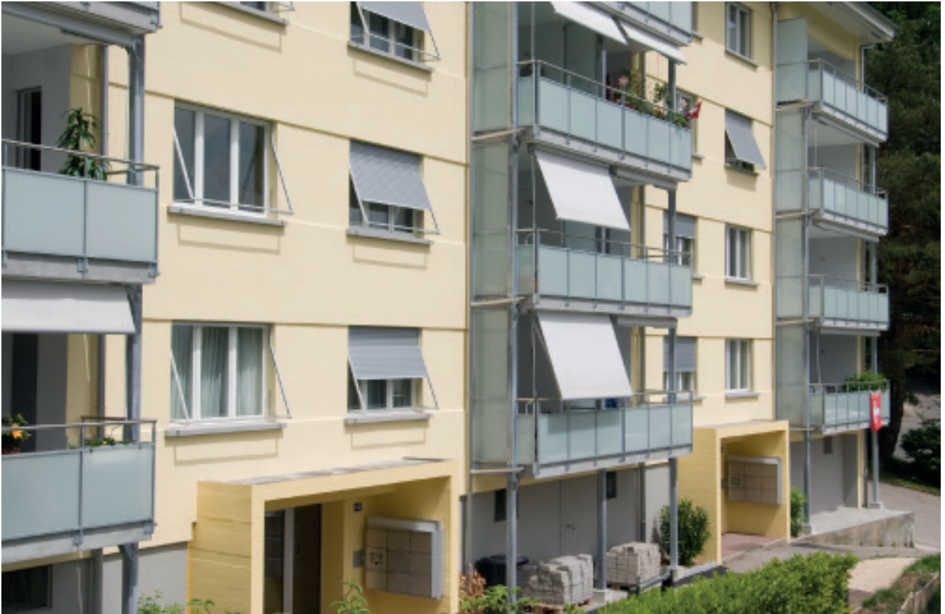
Aqua PuraVision® System MD