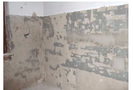
Dispersionsrückstände Fixit 125 / Fixit 632 Rapid