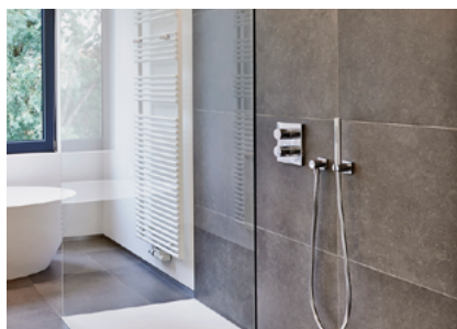
Für grosse keramische Wandplatten \geq 1600 \text{ cm}^2 Fixit 632 Rapid