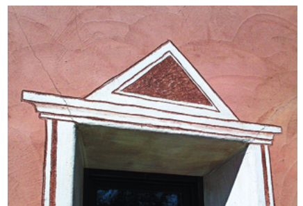
Putzrisse Fixit 460 / Fixit 461