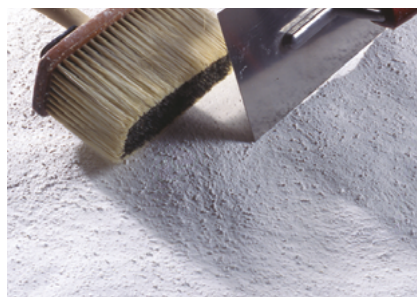
Modellier-Deckputz zum Streichen Fixit 460 / Fixit 461 / Fixit 462