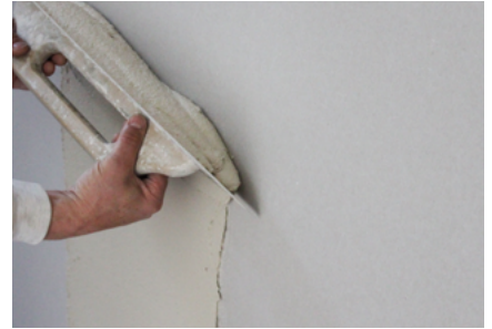
Direkt auf Gipskarton Fixit 125