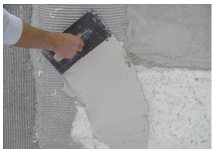
Unterschiedliche alte Untergründe Fixit 125 / Fixit 632 Rapid