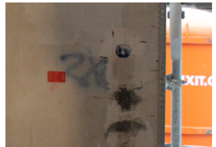
Alte Kunstharzoberputze Fixit 460 / Fixit 461 / Fixit 462