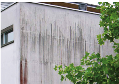
WDVS-Fassaden Sanierung Fixit 461