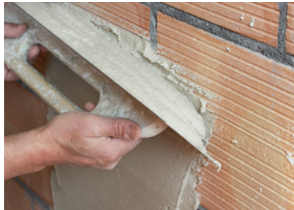
Direkt auf Backstein oder KS Fixit 125 / Fixit 632 Rapid