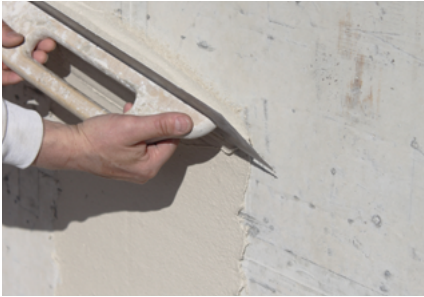
Direkt auf Beton Fixit 125 / Fixit 632 Rapid