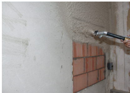
Untergrundaussgleich Fixit 125* / Fixit 632 Rapid