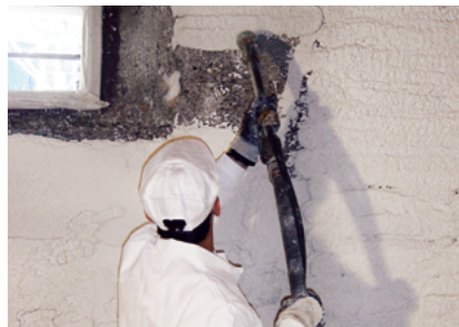
Untergrundausgleich Fixit 462