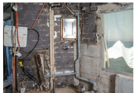
Badsanierung Fixit 632 Rapid