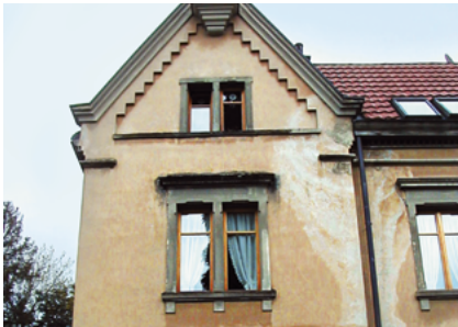
Fehlerhafte Putzflächen Fixit 462