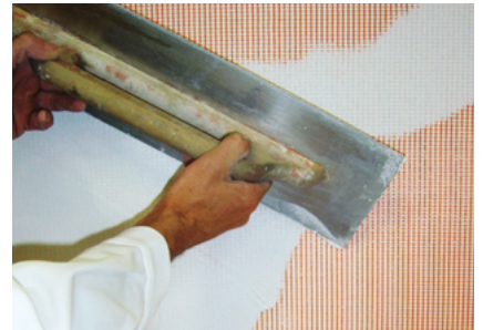
Armierungsgewebe einbetten Fixit 460 / Fixit 461 / Fixit 462