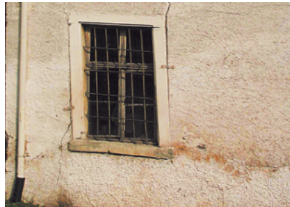
Unschöne Putzflächen Fixit 460 / Fixit 461 / Fixit 462