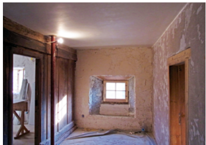
Unterschiedlich starke Ausbrüche Fixit 125 / Fixit 632 Rapid