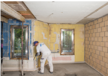
Unterschiedlich starke Ausbrüche Fixit 462