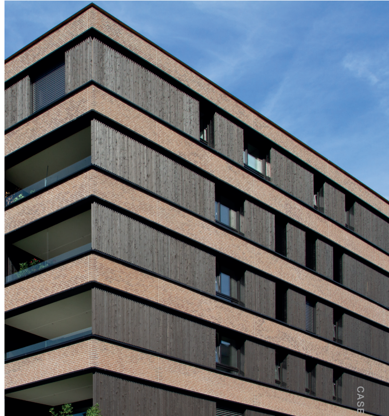
CASE STUDY // MEIN SEEDOMIZIL, LOCHAU