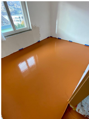
Zimmer nach fertigem Einbau