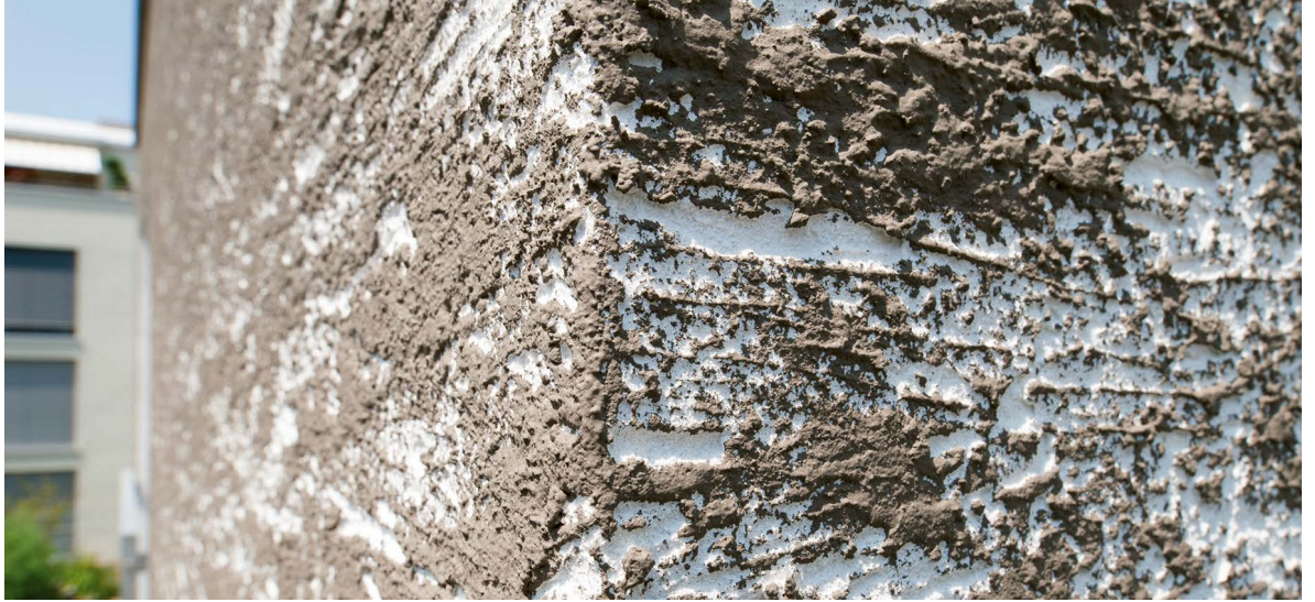
Immeuble d'habitation à Oberwil, surface : 360 m 2 . Structure du système : isolation avec EPS Lambda White 031, 160mm; enrobage du treillis Greutol Enduit Combi 488; couche de finition Greutol Enduit de finition extérieur plein universel rainuré 5.0mm; peinture GreoColor OptiTop.