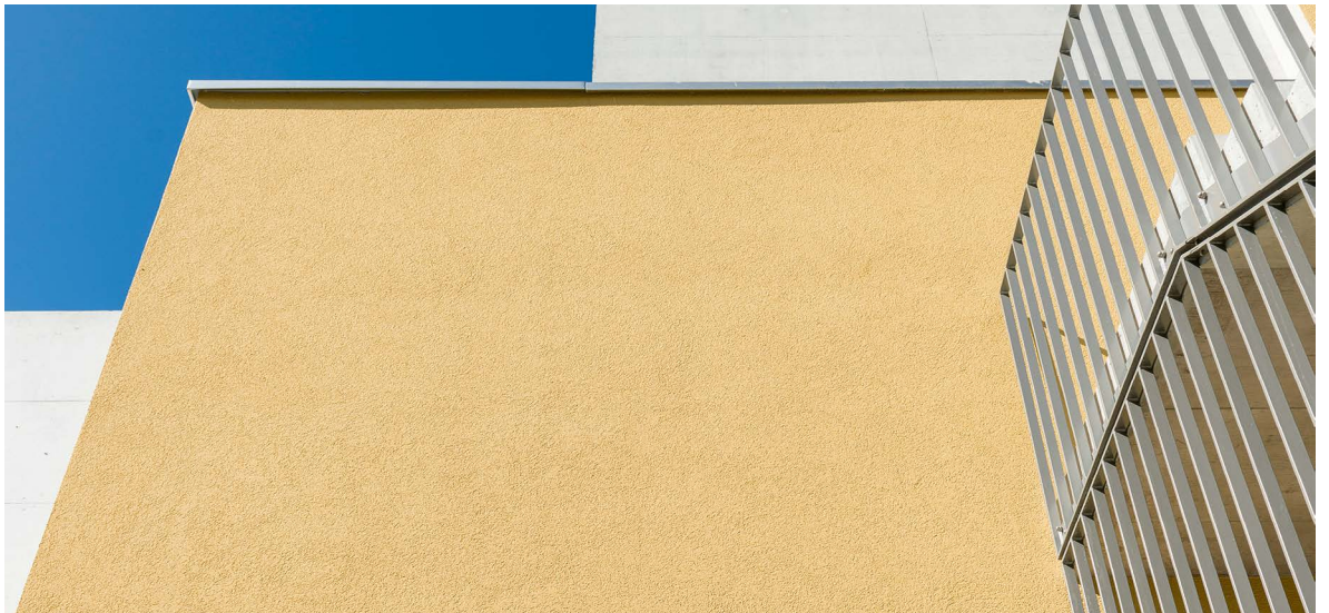
Immeuble d'habitation à Brugg, surface : 4200 m 2 . Structure du système : isolation avec EPS 200mm; enrobage du treillis Greutol Enduit Combi 488; couche de finition Greutol Ribage précieux 400 extérieur plein 2.0mm; peinture GreoColor OptiSilc.