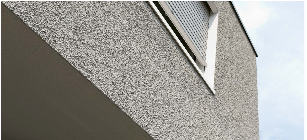
Maison à deux appartements à Fislisbach, surface : 370 m 2 . Structure du système : isolation avec EPS Lambda Plus 180mm; couche de fond Greutol Mortier d'enrobage light 425; enrobage du treillis Greutol Multimortier 406; couche de finition Greutol Crépi à la truelle 300, 6.0mm; peinture GreoColor OptiTop.