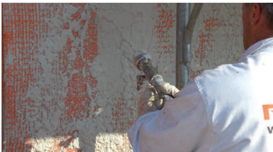
RÖFIX SismaCalce® Einbettungsmörtel in einer Schichtdicke von ca. 3 mm auftragen

Den RÖFIX SismaCalce® Einbettungsmörtel in einer Schichtstärke von ca. 3 mm über dem Mauerwerksriss oder der Präventionszone auftragen. Hierzu muss dieser der Länge nach, in der Breite des einzubettenden RÖFIX SismaProtect Erdbebenschutzgewebes, aufgetragen und dieses in den frischen Mörtel eingebettet werden. Das gut einmassierte Erdbebenschutzgewebe mit 5 mm RÖFIX SismaCalce® frisch-in-frisch überdecken (Gesamtdicke 8 mm).