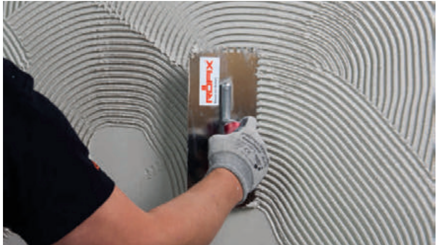
RÖFIX SismaCalce® Einbettungsmörtel auf der Oberfläche aufkämmen

Wenn das RÖFIX SismaCalce® System später mit Grundputz überarbeitet wird, den frischen RÖFIX SismaCalce® Einbettungsmörtel auf der Oberfläche aufkämmen oder gut aufrauen.