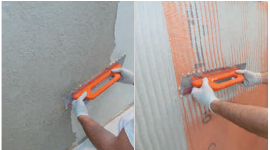
Armierungsschicht mittels RÖFIX Renoplus® mit eingebettetem RÖFIX P50

Das RÖFIX SismaCalce® Erdbeben- und Rissaniersystem ist im Aussenbereich in jedem Fall mit Grundputz oder einer Spachtelmasse und einem Oberputz zu überarbeiten. Das Armierungsgewebe RÖFIX P50 kann idealerweise mit der Renovierspachtelmasse RÖFIX Renostar® oder RÖFIX Renoplus® eingespachtelt werden.