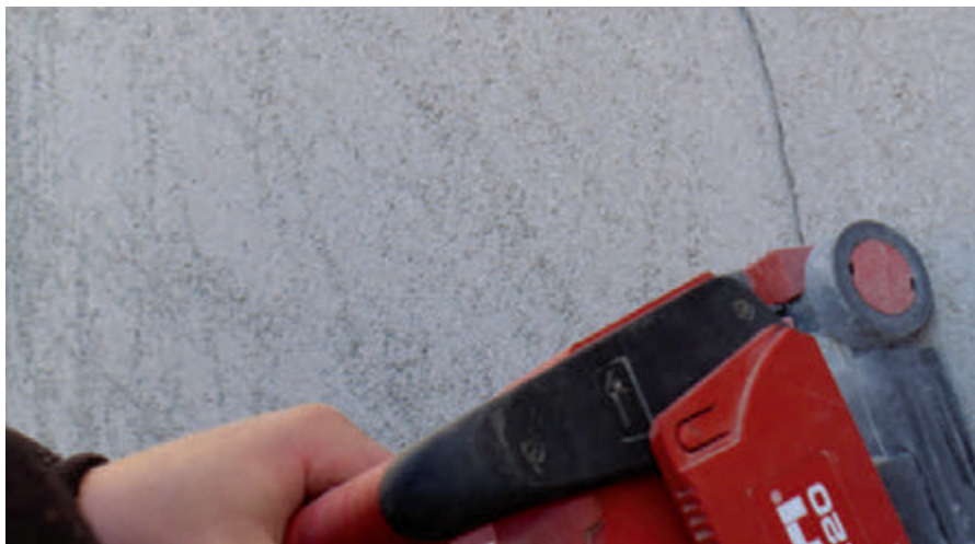
Konstruktionsbedingten Riss oder Kerbriss aufpräsen

Als tragfähiger Untergrund muss der Putz mindestens 2,5 N/mm Druckfestigkeit oder mindestens 0,25 N Haftzugfestigkeit aufweisen. Daher müssen Farb- und Oberputzbeschichtungen an den Stellen, wo das RÖFIX SismaCalce® Erdbebenschutz- und Rissaniersystem eingesetzt wird, immer bis auf den tragfähigen Grundputz-Untergrund entfernt werden. Den Grundputz mit dem mineralischen Verfestiger, RÖFIX PP 211, festigen. Die offene Rissfuge gut mit RÖFIX Creteo®Repair CC 150 verfüllen.