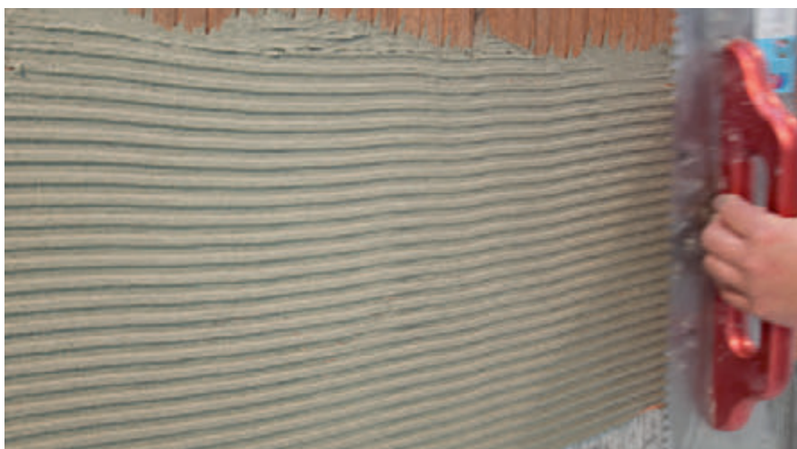
Übergangabsicherung von Betondeckenkränzen zum Ziegelmauerwerk

Für eine Rissprävention können Übergangsbereiche und Mischuntergründe aus verschiedenen Baumaterialien (beispielsweise Übergänge von Betondeckenkränzen zum Ziegelmauerwerk) mit dem RÖFIX SismaCalce® Rissaniersystem abgesichert werden. Speziell Treppenhäuser weisen häufig viele solcher unterschiedlichen Spannungsfelder zwischen Deckenplatten, Innen- und Aussenwänden sowie statisch beanspruchten Betonscheiben auf, die zu Rissen neigen. Das RÖFIX SismaCalce® System kann derartige Risse in den meisten Fällen verhindern.