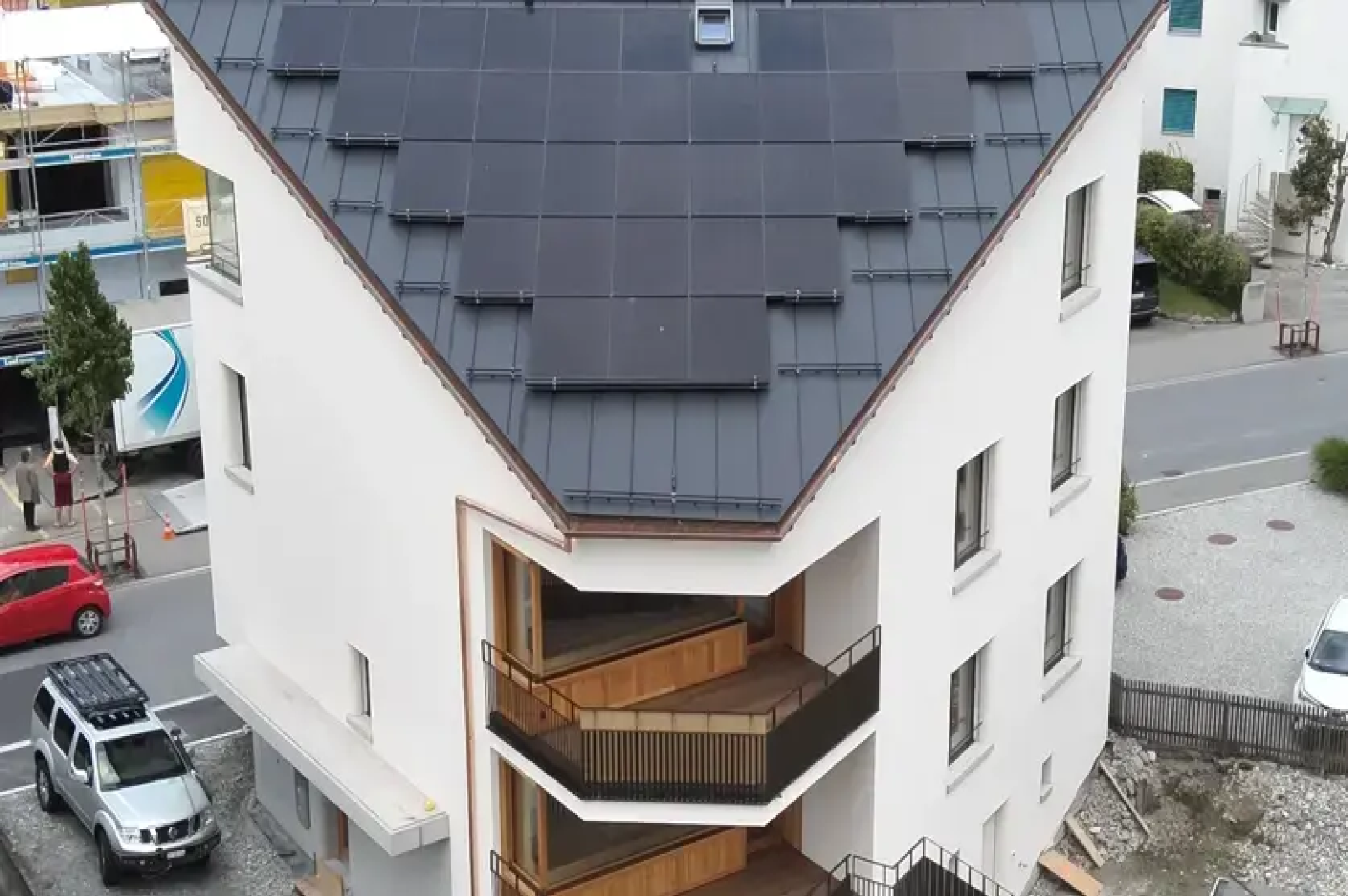
Maison individuelle Oberalpstrasse Chur