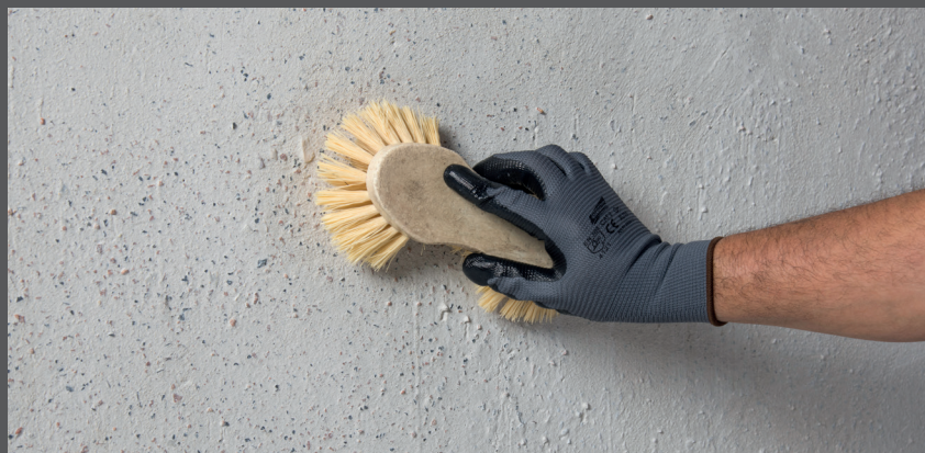
După uscare periați liantul cu apă

După prima uscare/întărire, udați stratul sinterizat cu o perie grosieră și cu suficientă apă. Apoi îndepărtați liantul pentru a descoperi agregatele colorate.