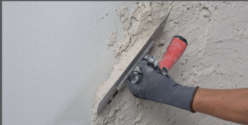
Aplicați RÖFIX 793 SalePepe și lăsați să se întărească

Aplicați amestecul cu RÖFIX 793 SalePepe în două straturi. Lăsați tencuiala spălată aplicată în spațiul interior să se întărească timp de aproximativ 8-12 ore, în funcție de temperatura camerei.