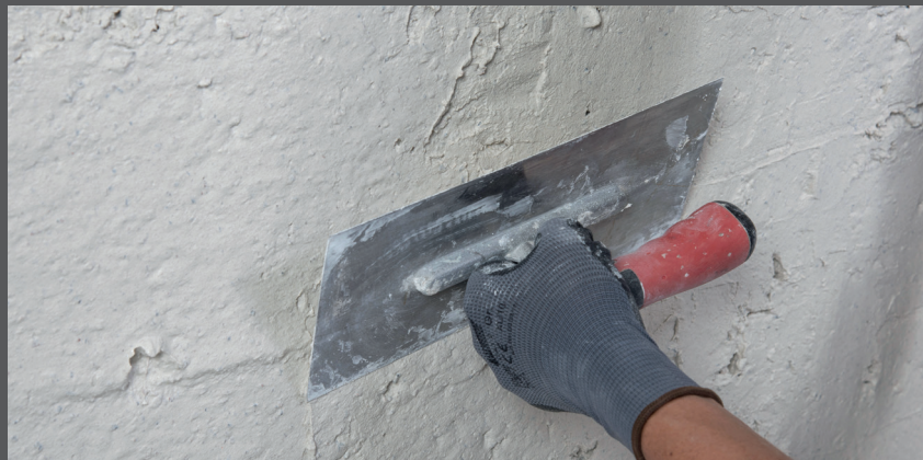
Aplicați al doilea strat de RÖFIX 793 SalePepe

Lăsați tencuiala spălată RÖFIX 793 SalePepe să se întărească pe fațadă. Timpul de uscare variază în funcție de temperatura exterioară.