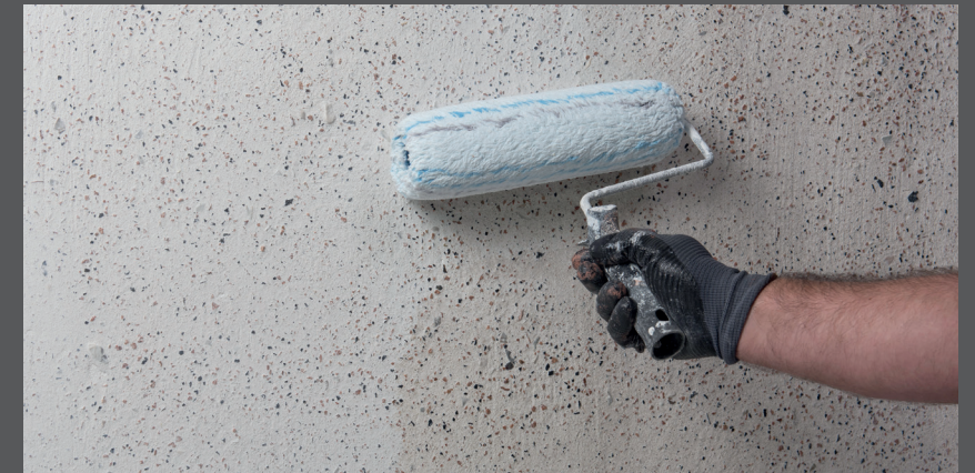
Aplicați un strat de grund și de acoperire cu lazură cu rășină siliconică RÖFIX PP 403 MULTI

După ce tencuiala spălată s-a uscat (aproximativ 5-7 zile în condiții de vreme bună), amorsați cu lazura de rășină siliconică RÖFIX PP 403 MULTI o dată prin diluare cu apă în raport de 1:3 și, odată ce grundul s-a uscat, acoperiți o dată cu lazură cu rășină siliconică RÖFIX PP 403.