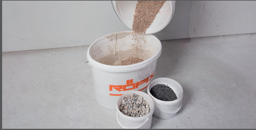
Amestecați cu granule de piatră rezistente la îngheț

RÖFIX 793 SalePepe este un produs semifabricat alcătuit dintr-un amestec special de lianți. Pentru a pregăti tencuiala spălată RÖFIX SalePepe pentru a fi gata de aplicare, trebuie amestecată conform fișei tehnice și combinată cu agregate rezistente la îngheț. Proportia granulației de sprijin ar trebui să fie de cel puțin 40%. Dacă doriți să colorați tencuiala spălată RÖFIX 793 SalePepe, se poate realiza acest lucru pe șantier cu pigmenți anorganici.