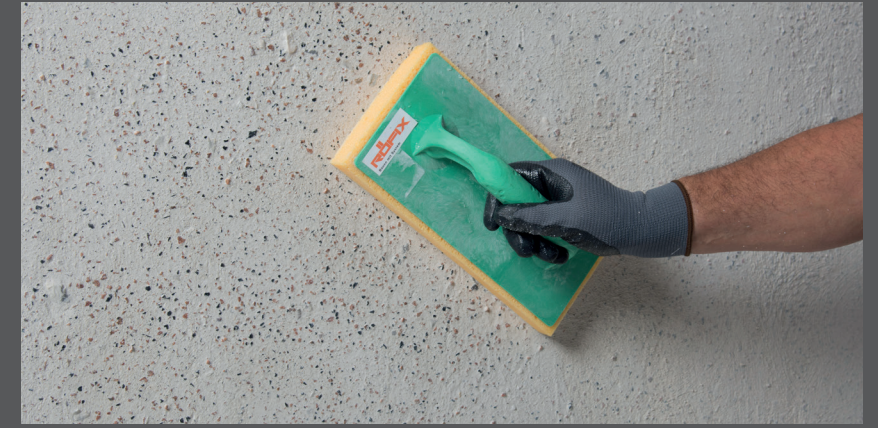
Utilizați placa cu burete pentru a spăla liantul de pe suprafață

Îndepărtați liantul înmuiat rămas de pe suprafață folosind o placă cu burete sau, în cazul unei structuri grosiere, folosind un burete cu suficientă apă.