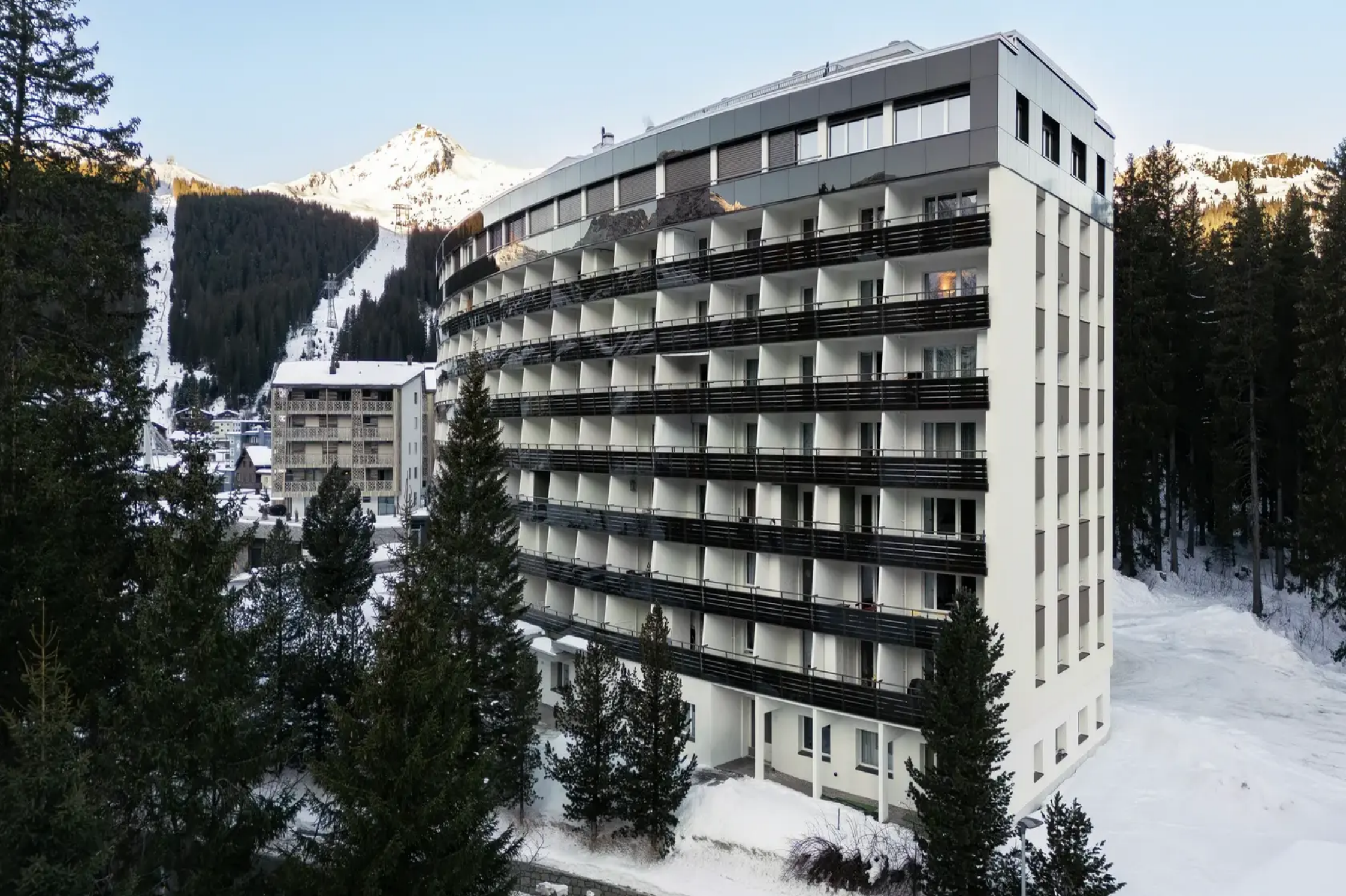
Ensemble résidentiel Casa Alexandra Arosa