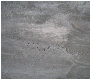
Beton (mit Putzhaftvermittler)