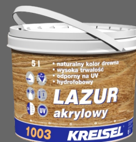
LAZUR AKRYLOWY 1003 do malowania