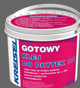
GOTOWY KLEJ DO PŁYTEK 111 do montażu