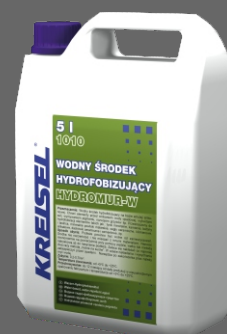
HYDROMUR-W 1010 do zabezpieczenia