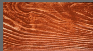
DESKA ELEWACYJNA 160x1980x3,0 mm