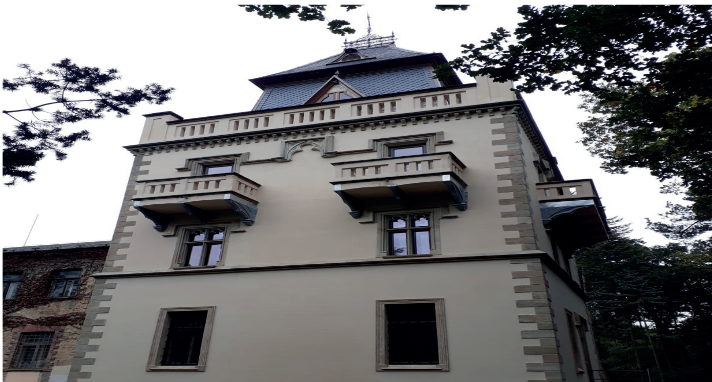
Sanace a renovace