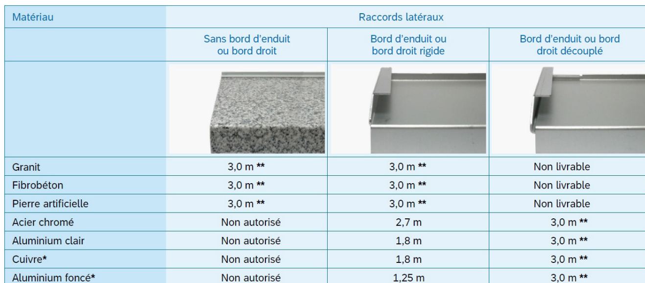
Tableau 5 tiré de la fiche technique de l'ASEPP n° 73 : longueurs maximales recommandées pour les appuis de fenêtre et seuils de porte en une seule pièce, avec une différence de longueur maximale par côté de 1,5 mm.

* La température de surface maximale des appuis de fenêtre et seuils de porte de couleurs sombres peut dépasser de 30°C celle des surfaces de couleurs claires. Plage de température prise en compte :