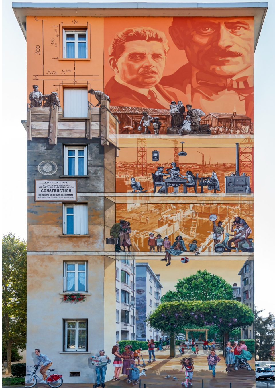
CITÉ TONY GARNIER AVEC DES MURS PIGNONS, F - LYON