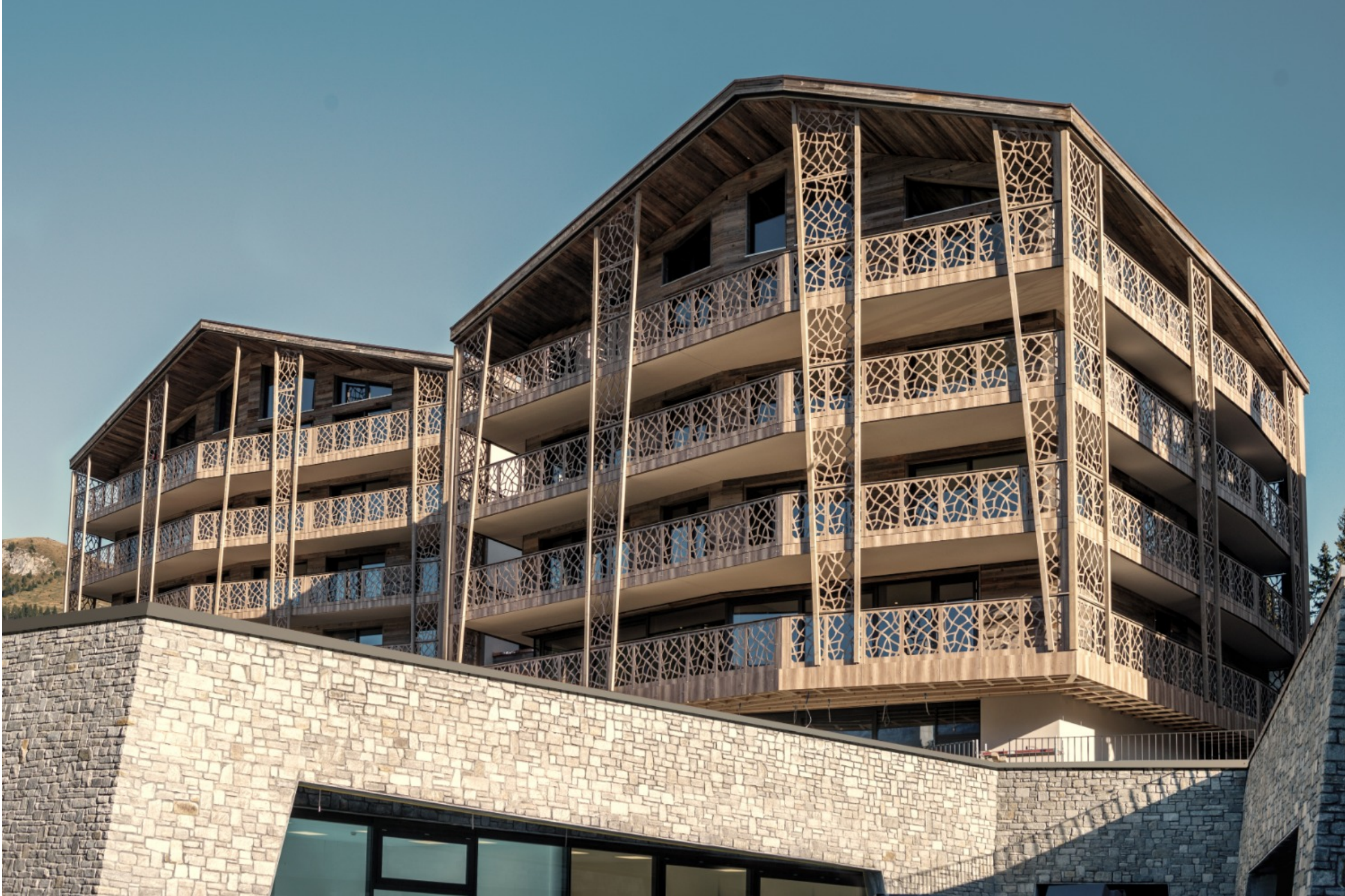
NATURSTEINVORMAUERUNG HOTEL VALSANA & APPARTEMENTS, AROSAFIXIT.CH