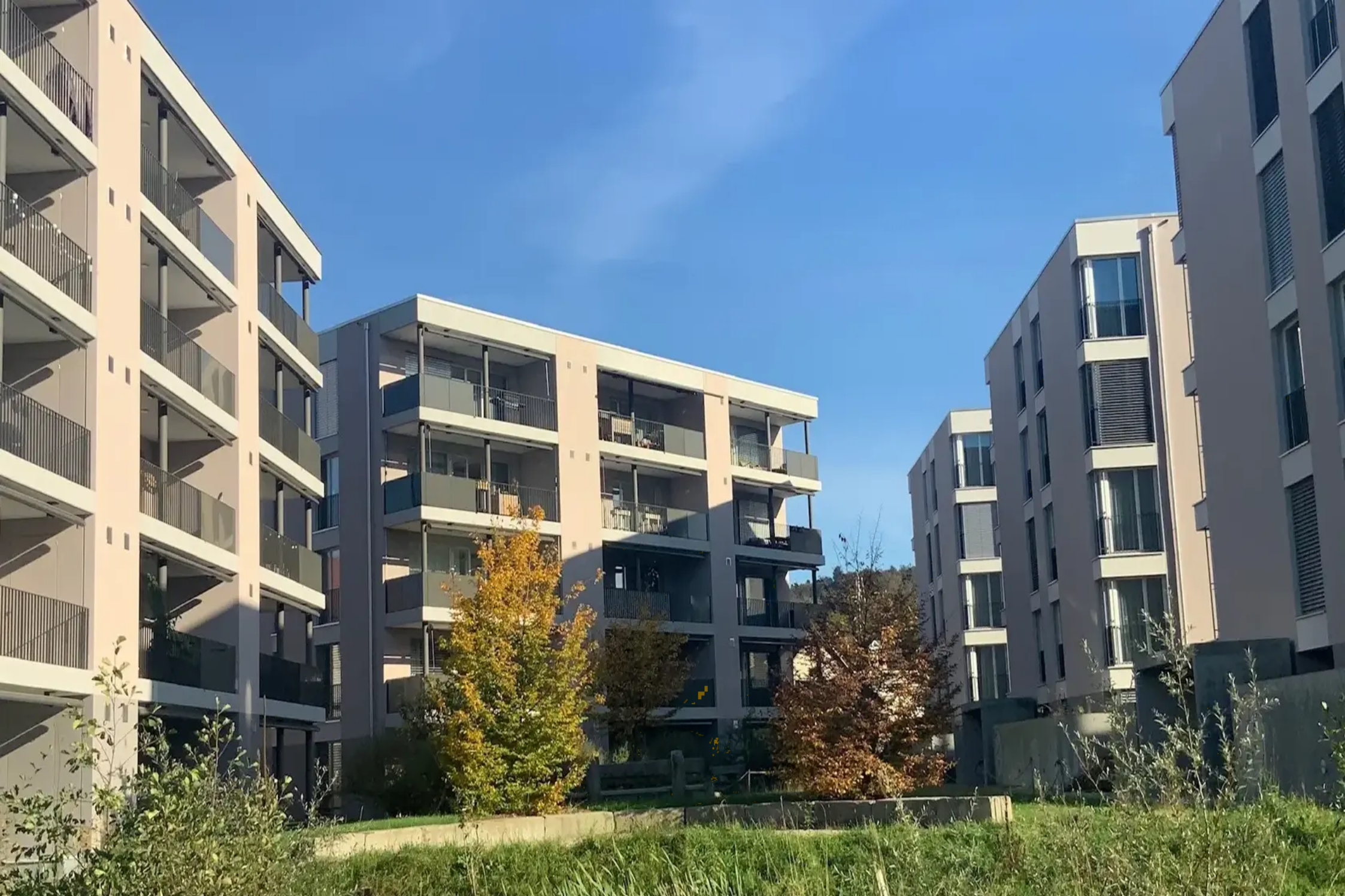
Ensemble résidentiel Bruggmühle Bischofszell