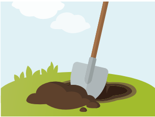
1 Loch ausheben