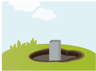
4 Fertig und nach wenigen Stunden belastbar