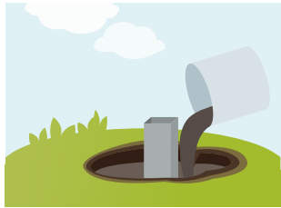
2 Trockenmaterial lagenweise (max. 20 cm Schichtdicke) einfüllen