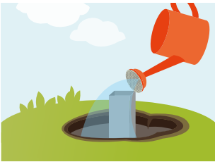
3 Mit vorgegebener Wassermenge begießen