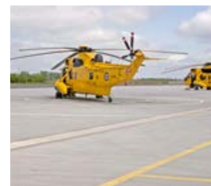
Ceste i parkirna mjesta na aerodromima