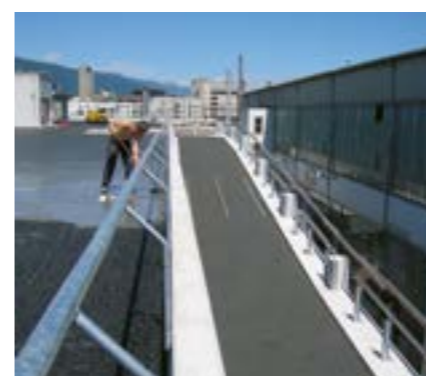
Parkirne garaže uključujući prilazne putove