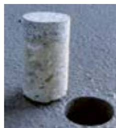
Creteo®Phalt na HVNS

Probna je jezgra (uzorak) uzeta s površine na teretnom terminalu, na kojem dnevno voze vozila s opterećenjem kotača od 100 tona.