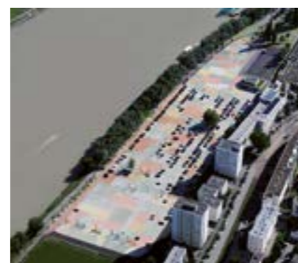
Površine za industrijsko skladištenje