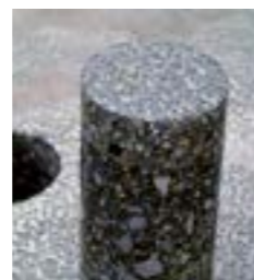
Creteo®Phalt na ASFALTU