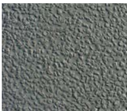
Creteo®Phalt - gotova obloga

Creteo®Phalt malter posebno je razvijen za ispunjavanje poroznih asfaltnih konstrukcija sa šupljinama. Creteo®Phalt malter obilježava vrlo kratko vrijeme vezivanja u kombinaciji s vrlo brzim stvrdnjavanjem, a time i brzo puštanje u pogon i opterećenje površine već nakon 12–18 sati. Creteo®Phalt malter kompenzira skupljanje, zbog čega se smanjuju mikropukotine na površini i izbjegavaju štetne pukotine u konstrukciji. Sistemski uslovljene pukotine su moguće i regulisane pomoću RVS 08.16.03/2014.