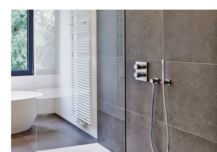
Pour des grands carreaux muraux en céramique \geq 1600 cm 2 Fixit 632 Rapid