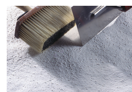
Enduit de finition et de modelage à peindre Fixit 460 / Fixit 461 / Fixit 462