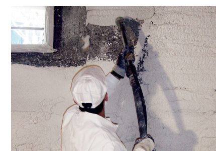
Égalisation de support Fixit 462