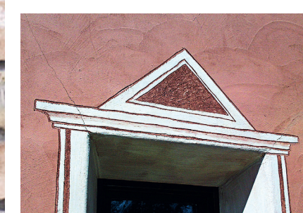
Fissures d'enduit Fixit 460 / Fixit 461