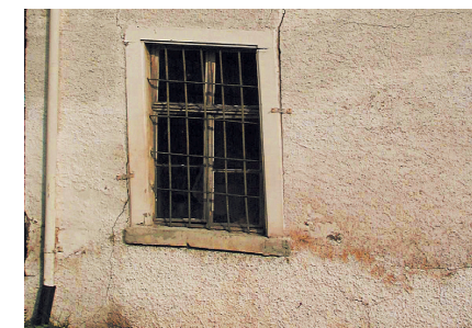
Surfaces d'enduit inesthétiques Fixit 460 / Fixit 461 / Fixit 462