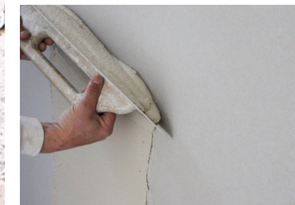
Directement sur le plâtre cartonné Fixit 125