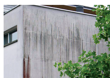
Assainissement de façades SITE Fixit 461