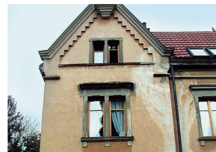
Surfaces d'enduit imparfaites Fixit 462