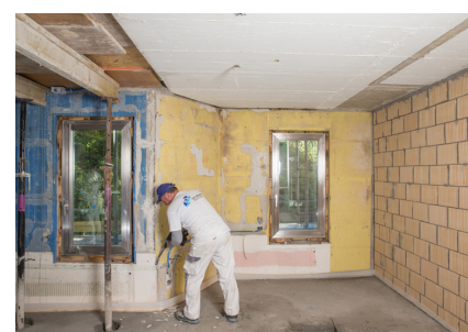
Ebréchantures de différentes épaisseurs Fixit 462