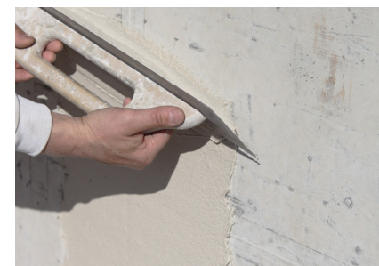
Directement sur le béton Fixit 125 / Fixit 632 Rapid