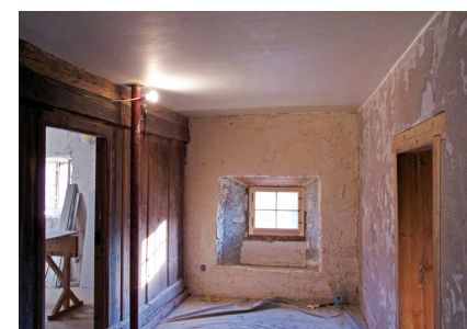
Ebréchures de différentes épaisseurs Fixit 125 / Fixit 632 Rapid