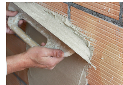
Directement sur la brique ou la brique silico-calcaire Fixit 125 / Fixit 632 Rapid