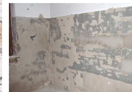
Résidus de dispersion Fixit 125 / Fixit 632 Rapid