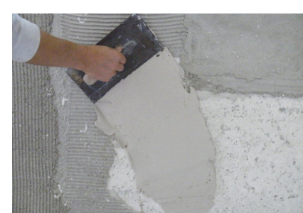
Anciens supports différents Fixit 125 / Fixit 632 Rapid