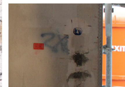
Anciens enduits à la résine synthétique Fixit 460 / Fixit 461 / Fixit 462