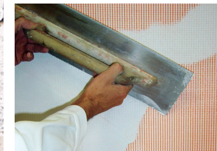
Enrobage de treillis d'armature Fixit 460 / Fixit 461 / Fixit 462