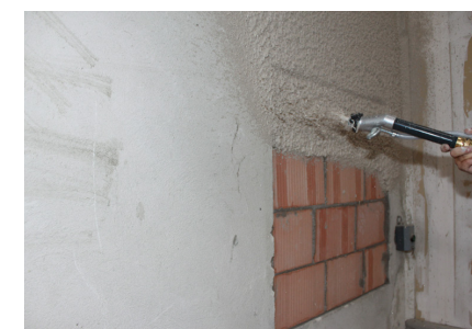
Égalisation du support Fixit 125* / Fixit 632 Rapid