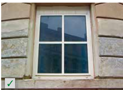
Unterschiedliche Untergründe RÖFIX Renostar®, RÖFIX Renoplus®