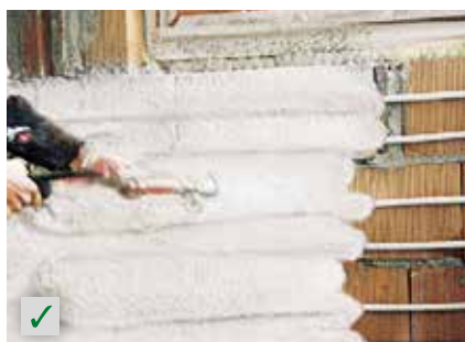
Wandheizungs-Einbindung in Putz RÖFIX Renoplus®