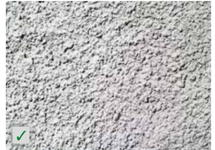
Grobe Oberputze RÖFIX Renostar®, RÖFIX Renoplus®