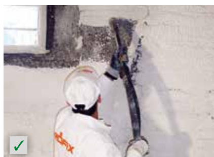
Untergrundaussgleich vor Endbeschichtungen (neue Farben, Oberputze) RÖFIX Renoplus®