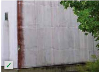
Veralgung RÖFIX Renostar®, RÖFIX Renofino®