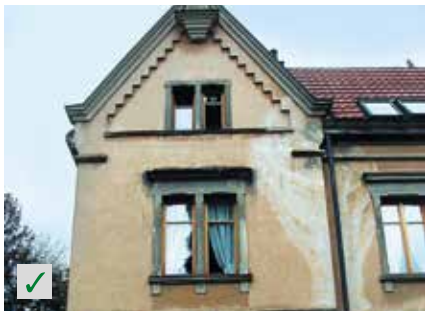
Alte Oberputze, Fassaden RÖFIX Renostar®, RÖFIX Renoplus®, RÖFIX Renofino®