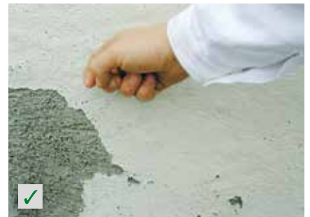
Alte Farbanstriche RÖFIX Renostar®, RÖFIX Renoplus®, RÖFIX Renofino®