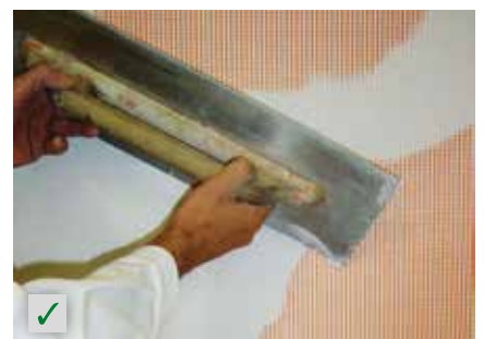
Armierungsschicht bei problematischen Untergründen RÖFIX Renostar®, RÖFIX Renoplus®