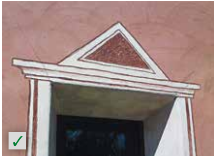
Putzrisse RÖFIX Renostar®, RÖFIX Renoplus®