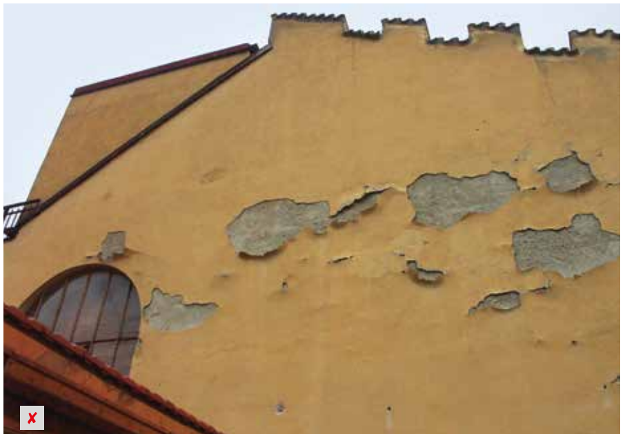
Renovierungs-Ergebnisse mit zu dichten oder zu starren Spachtelmassen

Die Lösung dieser Problematik ist das altbewährte Bindemittel Kalk, das in allen Produkten der RenoFamily enthalten ist. Die hauptsächlich mit Kalk gebundenen Spachtelmassen RÖFIX Renostar®, RÖFIX Renoplus®, RÖFIX Renofino® sowie die Glätte RÖFIX Renofinish® vereinen