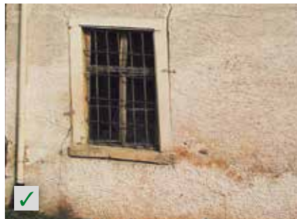
Schmutzige Oberflächen, Fassaden RÖFIX Renostar®, RÖFIX Renoplus®