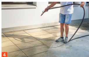
4 Namočite vodom