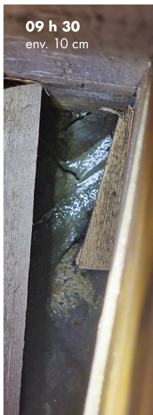
09 h 30 env. 10 cm

Comme prévu, la petite zone problématique dans la partie centrale de la conduite, où les murs et le plafond s'étaient partiellement effondrés, n'a pas constitué un obstacle pour notre béton mousse fluide Fixit POR.