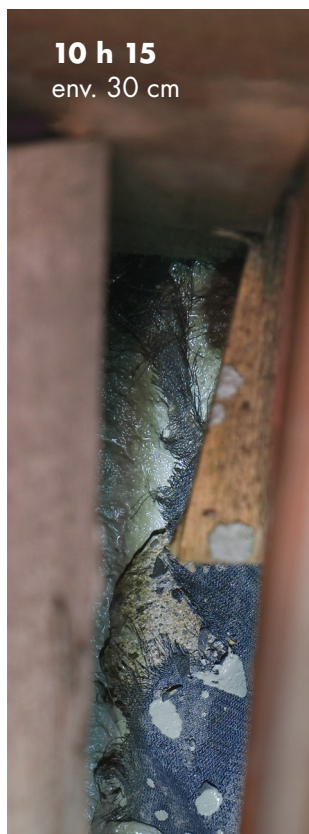
10 h 15 env. 30 cm