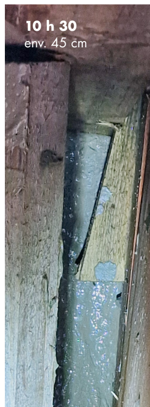
10 h 30 env. 45 cm