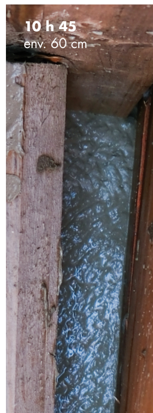
10 h 45 env. 60 cm