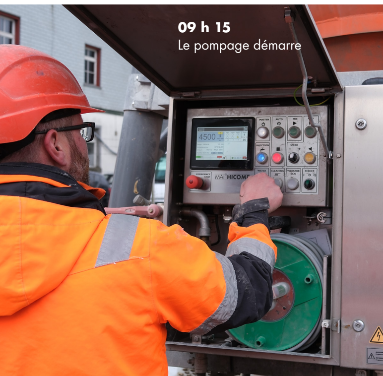
09 h 15 Le pompage démarre