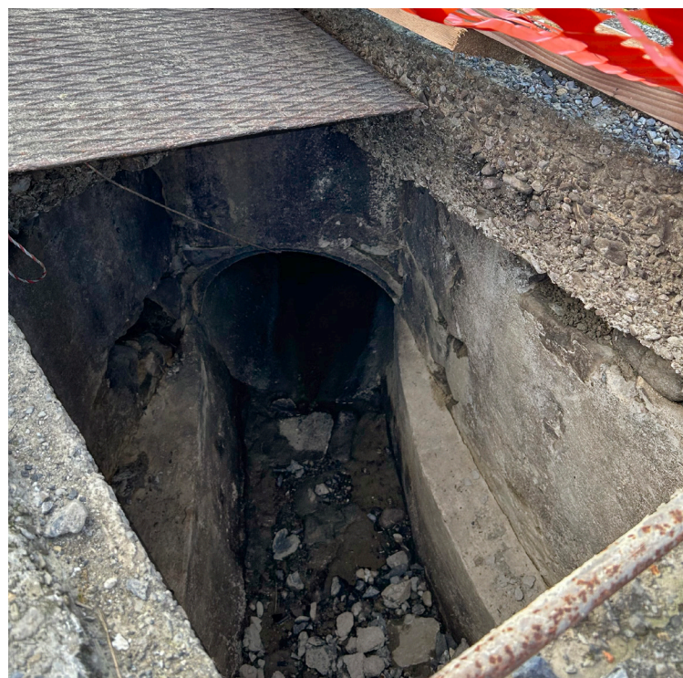
Installation du tuyau d'alimentation et de trop-plein ; cette ouverture a ensuite été étanchée et comblée.

Lorsque tous les préparatifs sont terminés, le comblement de la cavité peut commencer.