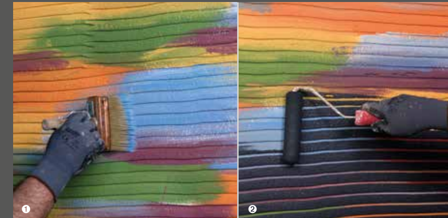
Grundieren, bunt vorstreichen und Spitzen monoton übermalen

2 Bei mit Farbstrich vorbereitetem Kammzug mit Schaumstoffwalze - in einem weiteren Farbton - die Spitzen übermalen.