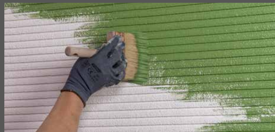
Kammzug grundieren und zweimal streichen

Kammzug grundieren und zweimal streichen.