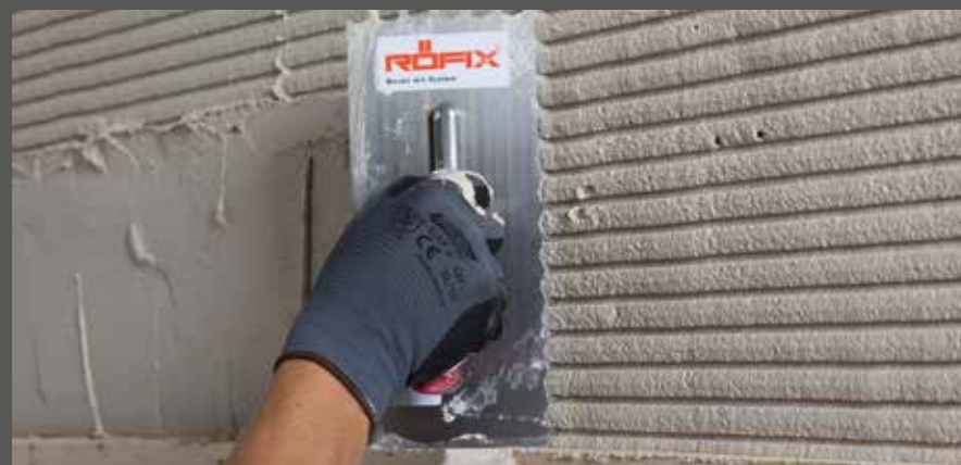
Gerichteten Kammzug vorziehen

Die Zahnung bei horizontalen Kammzügen so wählen, dass das Wasser aus den Nuten (Geometrie der Kammzüge schräg nach aussen geneigt) ablaufen kann.