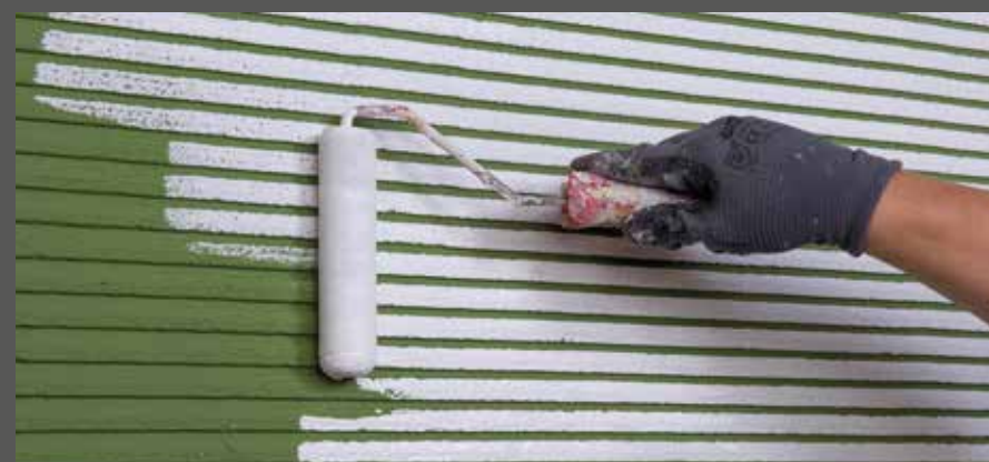
Spitzen in einem anderen Farbton überstreichen

Mit Schaumstoffwalze die Spitzen des Kammzuges in einem zweiten Farbton überstreichen.