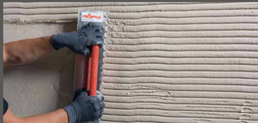
Freien Kammzug vorziehen

Bei freiem Kammzug ohne Anschlaglatte, RÖFIX DESIGNPUTZ aufspritzen oder aufziehen und mit geeigneter Zahntraufel in die gewünschte Richtung ziehen.