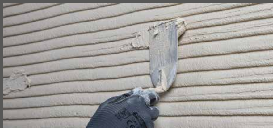
Nach dem Ansteifen Material auffüllen

Nach dem Ansteifen des Materials (bei warmer Witterung am selben Tag möglich), Hohlstellen auffüllen und nochmal mit der Zahntraufel durchziehen.