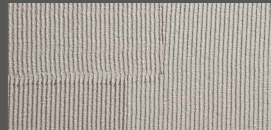
Ideale Anordnung der Absätze bei freiem Kammzug

Bei freihändig gezogenen Kammzügen empfiehlt es sich, die Absätze so anzuordnen, dass sie in der fertigen Fläche ein gleichmässiges Bild ergeben.