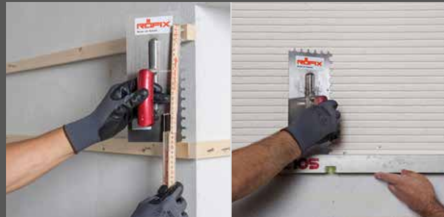
Leistenmontage für gerichteten Kammzug oder Unterstützung mit Waaglatte

Bei Zahnsteghöhen die 10 mm überschreiten, mit WDVS- Klebe- und Armierungsmörtel (z.B.: RÖFIX Unistar® LIGHT), mit einer feinen Zahntraufel (ca. 6 mm) kreuz und quer aufkämmen und die Aufzahnung trocknen lassen. Am Folgetag mit RÖFIX DESIGNPUTZ darauf glatt abspachteln und in einem zweiten Arbeitsgang den groben Kammzug in der gewünschten Struktur aufziehen. Bei gerichtetem Kammzug vorab Abzugsleisten einrichten und montieren. Variante: Eine zweite Person kann mit einer langen Waaglatte als Abzugsleisten unterstützen.