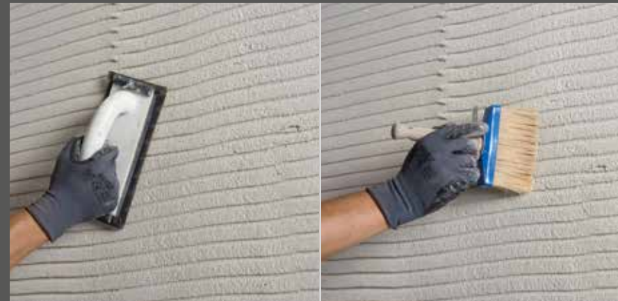
Kanten brechen und entstauben

Kanten des fertig gezogenen Kammzuges nach Trocknung brechen beziehungsweise schleifen und Kammzug entstauben.